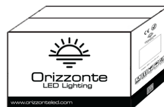
500 Metros por cartón